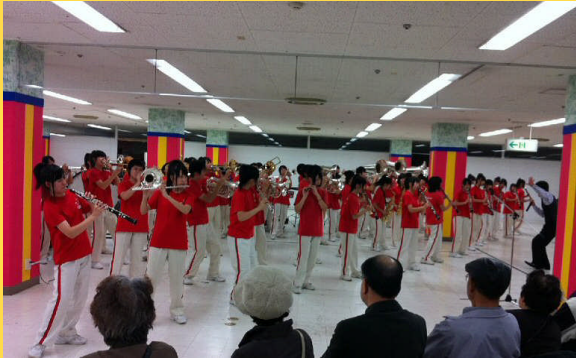
写真: 駅前プラザ egao(エガオ)での演奏