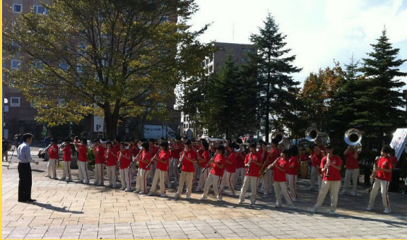
写真: 駅前広場での演奏

〒059-1292 苫小牧市錦岡521-293 TEL:0144-61-3111(代) FAX:0144-61-3333 http://www.t-komazawa.ac.jp